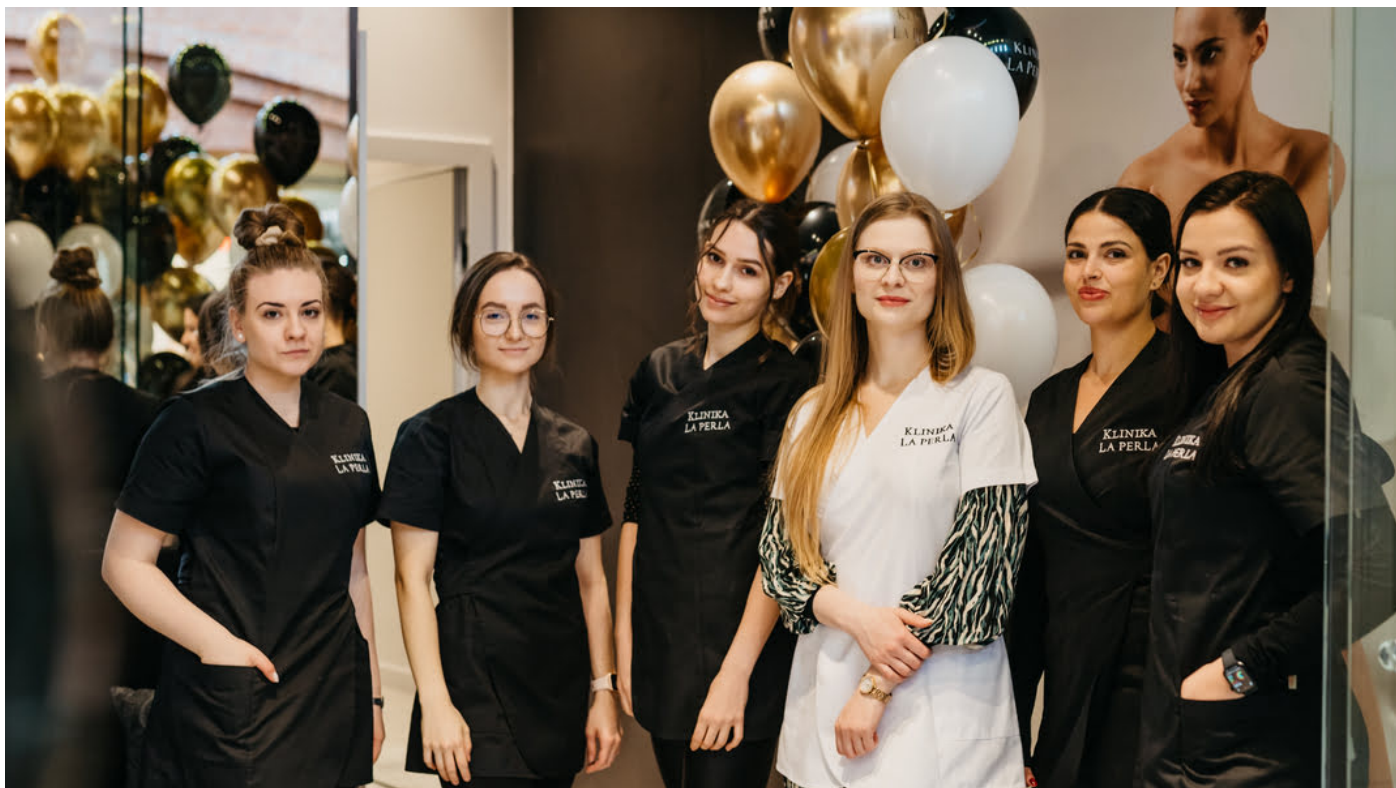
Klinika La Perla, Stary Browar

odbiorców zainteresowanych technologiami, trafiają do nas też najnowsze preparaty z medycyny estetycznej. Bardzo zależy im na naszej opinii – nie tylko na polskim rynku, ale i na rynku międzynarodowym – mówi Ben Sira.