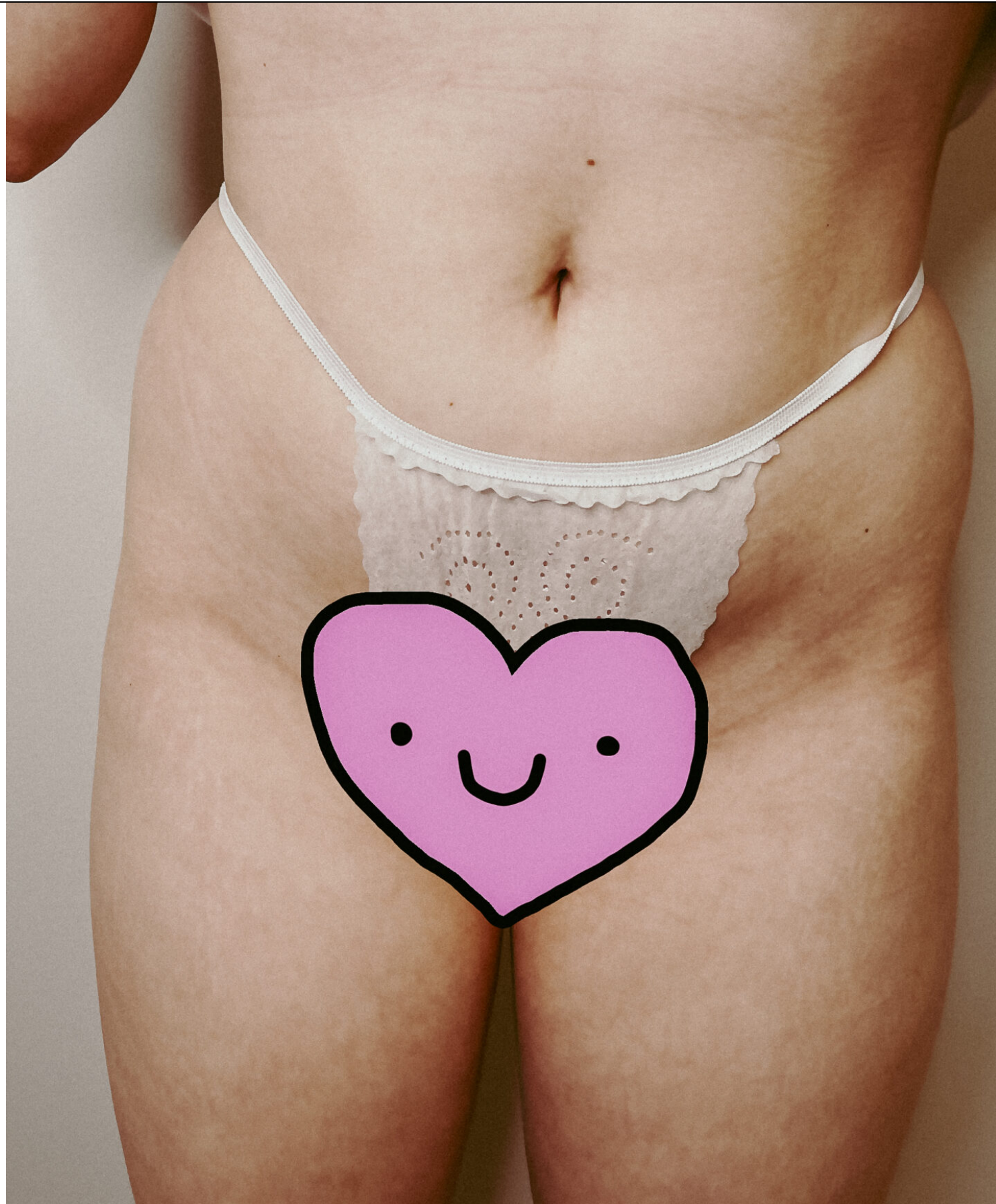
PRZED WONDER SHAPE